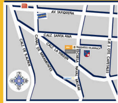
PLANTEL SUR Margarito Salamanca No. 5, Col. Presidentes Ejidales Tel. 5607-2180

SEP Incorporado a la SEP Plantel Oriente IZT09060543 Plantel Sur 09050350