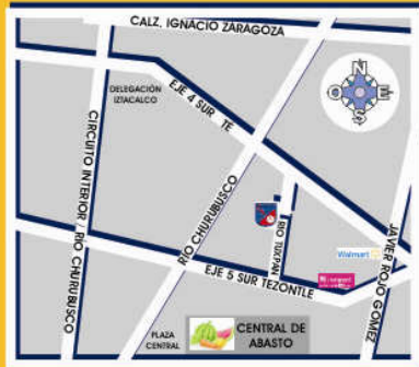
PLANTEL ORIENTE Río Tuxpan No. 72, Col. Paseos de Churubusco Tel. 5650-5931